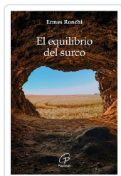
El equilibrio del surco Ermes Ronchi