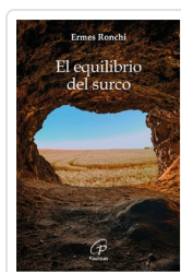
El equilibrio del surco Ermes Ronchi