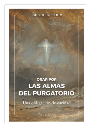
Orar por las almas del purgatorio Tassone, Susan