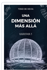
Una dimensión más allá De Hevia, Tono