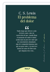
PROBLEMA DEL DOLOR, EL LEWIS, C.S.