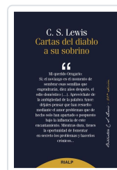
CARTAS DEL DIABLO A SU SOBRINO LEWIS, C.S.