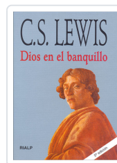
DIOS EN EL BANQUILLO LEWIS, C.S.