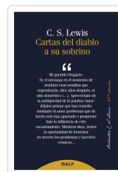
CARTAS DEL DIABLO A SU SOBRINO LEWIS, C.S.