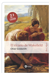
El vicario de Wakefield Goldsmith, Oliver