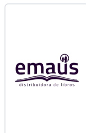
VIDA DE JESUS. (HIJAS S.P) PARAZZOLI, F