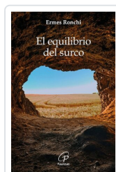
El equilibrio del surco Ermes Ronchi