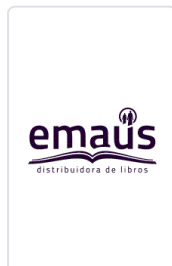
VIDA DE JESUS. (HIJAS S.P) PARAZZOLI, F