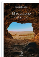
El equilibrio del surco Ermes Ronchi