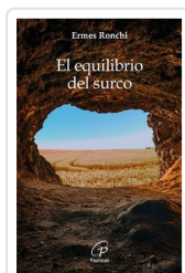
El equilibrio del surco Ermes Ronchi