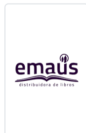
VIDA DE JESUS. (HIJAS S.P) PARAZZOLI, F