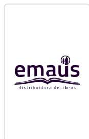
VIDA DE JESUS. (HIJAS S.P) PARAZZOLI, F