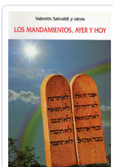
MANDAMIENTOS, AYER Y HOY SALVOLDI, VALENTIN