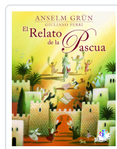
RELATO DE LA PASCUA, EL. GRUN, A./FERRI, G.