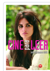
CINE PARA LEER 2008 JULIO- DICIEMBRE EQUIPO RESEDA