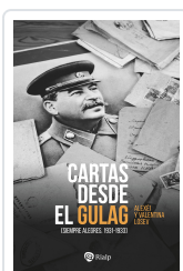
Cartas desde el Gulag Lósev, Alexei Fyodorovich ; Losev, Valentina