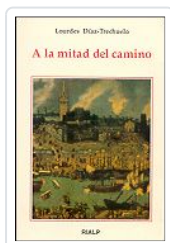
A LA MITAD DEL CAMINO DÍAZ TRECHUELO