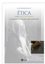
Ética para inconformes Juan Fernando Sellés Dauder