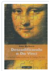
DESCODIFICANDO A DA VINCI WELBORN, AMY