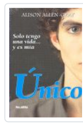
UNICO (NUEVA ED.) ALLEN GRAY