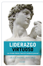
LIDERAZGO VIRTUOSO HAVARD