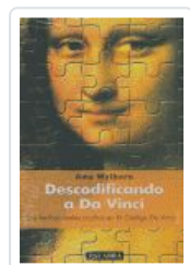
DESCODIFICANDO A DA VINCI WELBORN, AMY