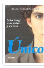
UNICO (NUEVA ED.) ALLEN GRAY