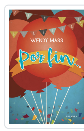
POR FIN... MASS, W.