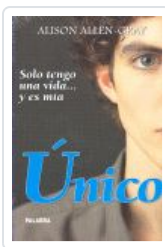
UNICO (NUEVA ED.) ALLEN GRAY