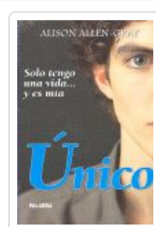
UNICO (NUEVA ED.) ALLEN GRAY