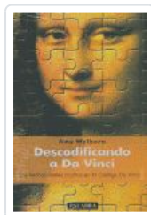
DESCODIFICANDO A DA VINCI WELBORN, AMY