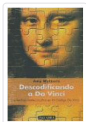
DESCODIFICANDO A DA VINCI WELBORN, AMY