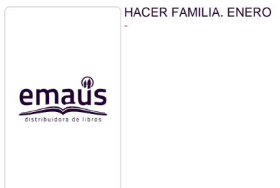
HACER FAMILIA. ENERO