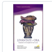
LEVANTATE Y ORA ALBINYANA I GIMENO, XIMO