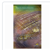
MARCADO EN EL VIENTO VAREA, MATIAS