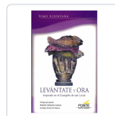
LEVANTATE Y ORA ALBINYANA I GIMENO, XIMO