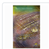
MARCADO EN EL VIENTO VAREA, MATIAS