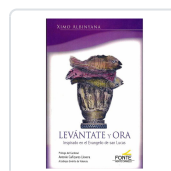
LEVANTATE Y ORA ALBINYANA I GIMENO, XIMO