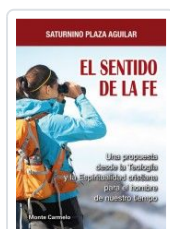
SENTIDO DE LA FE, EL PLAZA AGUILAR, SATURNINO