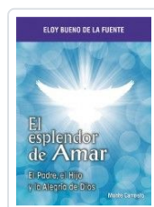
ESPLENDOR DE AMAR, EL BUENO DE LA FUENTE, ELOY