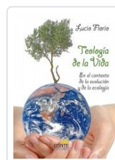
TEOLOGIA DE LA VIDA FLORIO, LUCIO