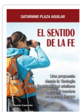
SENTIDO DE LA FE, EL PLAZA AGUILAR, SATURNINO