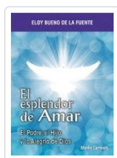
ESPLENDOR DE AMAR, EL BUENO DE LA FUENTE, ELOY